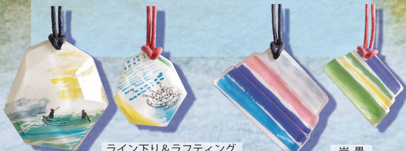
ライン下り&ラフティング