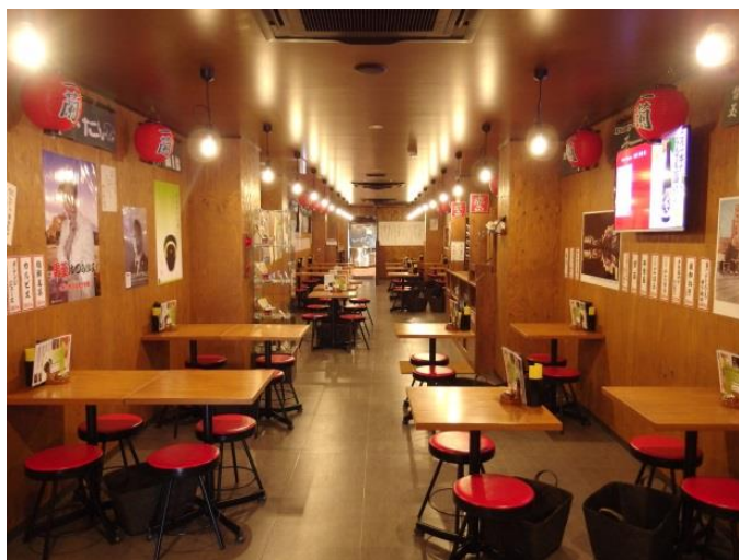
香港では初の「味集中カウンター」「一蘭屋台」の併設店舗となる。 写真左:味集中カウンター(コースウェイベイ店) 写真右:一蘭屋台(道頓堀店屋台館・大阪府)