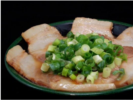
「釜だれとんこつ焼き豚皿」

現在日本国内では、福岡・大分・広島・大阪と一蘭屋台が広まりつつあります。味集中カウンターと一蘭屋台併設店舗が特に人気で、まさにチムサーチョイ店はその人気店の作りとなっております。更に、チムサーチョイ店では香港初上陸の新メニューも続々登場。おつまみにぴったりと日本で大人気の「釜だれとんこつ焼き豚皿」。抹茶を使用した“和スイーツ”として女性に大好評の「抹茶杏仁豆腐」。すっきりとした味わいの一蘭オリジナルブレンドのお茶「蘭茶」。厳選した上質な日本酒を、グラスから溢れるほど注ぎ込む「こぼし酒」。天然とんこつラーメン+αの新たな一蘭の魅力を心ゆくまでおたのしみいただけます。