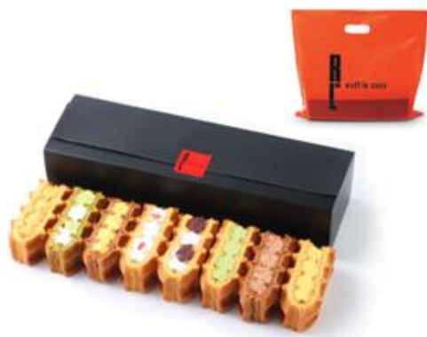
▲ シックな墨色のパッケージ