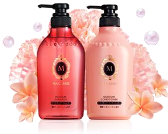
モイスチュア シャンプー & コンディショナー

▶「マシェリ」ブランドサイト http://www.shiseido.co.jp/macherie/