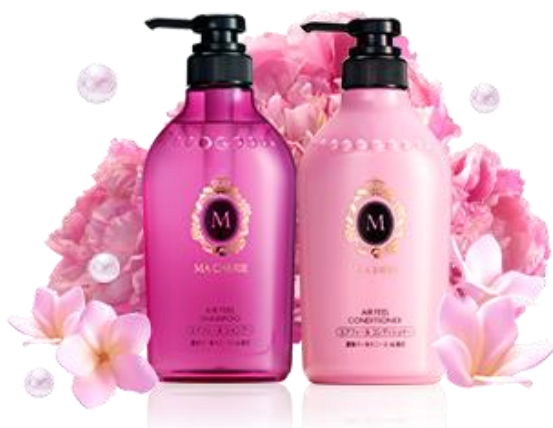
エアフィール シャンプー & コンディショナー

※つや・補修・保湿成分（パールコンキオリン・ハチミツ・ヒドロキシエチルウレア・ヒアルロン酸Na）