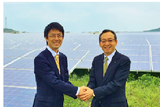
木南社長(左)と市川社長(右)

将来的な化石燃料の高騰、CO 2 排出削減などの観点から、世界各国が再生可能エネルギーの導入を進める中、日本国内における再生可能エネルギーの導入状況は、全体の約 11%※1 と、主要先進国に比べて低水準となっています。こうした状況を背景に、政府は 2015 年 6 月、「エネルギー・ミックス方針」を発表。現在の再生可能エネルギーの比率を 2030 年までに 22%~24%程度に高めることを目標として掲げたことから、今後同分野の更なる市場拡大が期待されています。