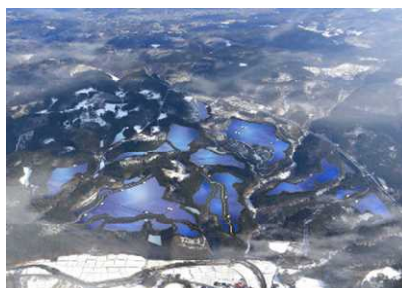
軽米西ソーラー(48MW 建設中)