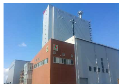
ユナイテッド・リニューアブルエナジー(バイオマス)