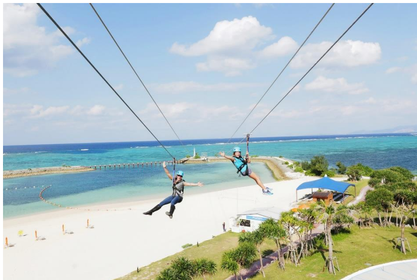
デッキから見た MegaZIP（メガジップ）

株式会社プロジェクト アドベンチャー ジャパンは、これまで日本全国に、28 ヶ所のアドベンチャー施設「アドベンチャーパーク」「ジップライン」の設計・施工を手掛けてまいりました。今回「PANZA Okinawa」は、当社が運営もすべて行う体験型施設です。