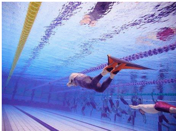
＜フィンスイミング体験会＞

日本のみならず世界中からスポーツに注目が集まる東京オリンピックが開催されます。その盛り上がりが高潮に達する2020年までに、様々な水泳大会の隣で「POOL JAM EXPO」の開催を計画しています。プールから生まれる新しい商品やサービスに人々の関心を集め、話題を喚起することで市場の活性化を目指します。業界の垣根を超えたJAM（融合）、「POOL JAM EXPO」の第一回に、是非ご期待ください。