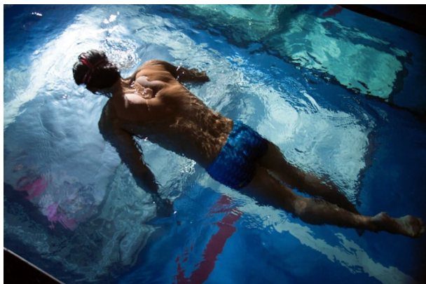
＜アクアサーネージ＞

日本にはプール用品の展覧会がなく、関連商品のメーカーは独自に販路を開拓する方法が一般的で、導入企業側も既存取引を継続する方法が一般的です。今回、「世界のプールをかきまわせ」というスローガンのもと、プールを舞台に人や企業、テクノロジーやアートが融合する体験型のアトラクション展示会「POOL JAM EXPO」を行うことで、プール用品のみならず、水泳業界を活性化することを目指しています。なお、「JAM」という言葉には、「自由に集まった人が即興演奏をし、その共演が新たな演奏を生む」という意味が含まれています。競泳用品メーカーとフィンスイマーのコラボレーション、プールとデジタル、アートとの融合、大企業とベンチャーの協業を促進することで、プール・水泳業界の活性化を目指します。