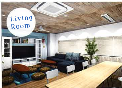
自身のキャリアアップを図りたいという向上心