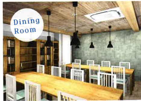
個人個人が自分の近い将来像を自ら考え育む場所