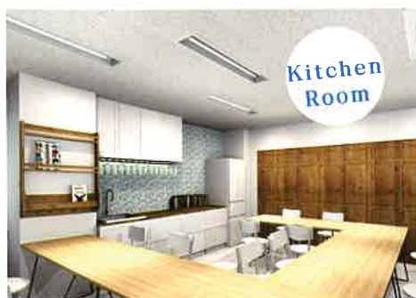
ホームステイを感じる空間

決して特別な場所という訳ではない、いわゆる単に「海外の街並みとホームステイ」を感じる空間。