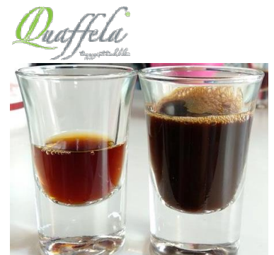
Non-chemical Chemical (こげ茶色) (黒色、泡立ち)

An's coffee では解決策調査の結果、昨年 10 月にホーチミンで唯一となるノンケミカルコーヒー専門店「Quaffela」がオープンしていることを発見。豆だけでなく日本製フィルタを利用するなど品質にこだわり、国際会議 APEC2017 でもサーブされるなど高い評価を受けるコーヒーであることが分かりました。実際に目の前で淹れてもらい、色や風味を市販のケミカルコーヒーと比べてみるとはっきりとした違いを感じることができました。 ( https://quaffela.com/ )