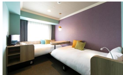
OMO7 旭川「DANRAN Room」