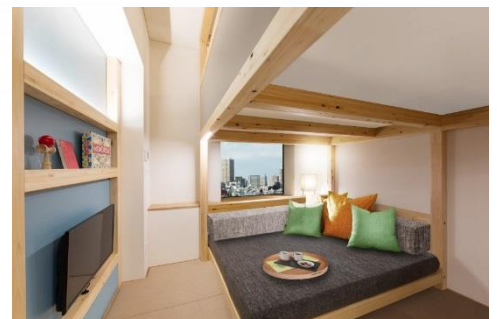
OMO5 東京大塚「YAGURA Room」