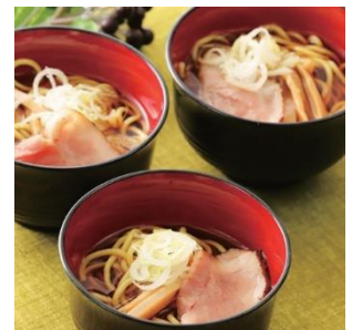
▲夜なきそば(380円)が無料に！

日本人がこよなく愛す 夜食「夜なきそば」、 コーヒー・紅茶・ビール・ハイボール・ワインの内1つを注文できます。宿泊日数分のチケットをプレゼントします。