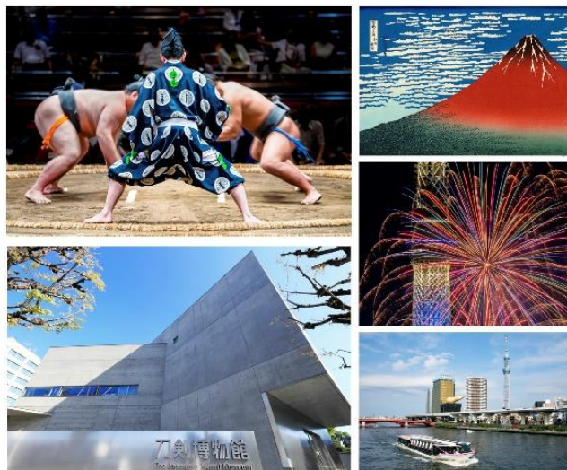
▲相撲、日本刀、浮世絵、花火など…日本の伝統・文化に触れられるスポットが多数集まる、東京・両国エリア。

ブエナ アルテ ホステルの最寄り駅「両国」には、日本の伝統を体験できるスポットが集結しています。「相撲」の聖地である「両国国技館」を筆頭に、浮世絵で有名な葛飾北斎の作品を展示する「すみだ北斎美術館」、多数の日本刀が集まる「刀剣博物館」、伝統的な日本式庭園(旧安田庭園)、「花火資料館」、「江戸東京博物館」など…和を感じられるスポットが盛りだくさん。いずれも、ホステルから徒歩10分圏内です。日本舞踊や三味線、江戸切子など、参加できる体験講座も多数開催されています。