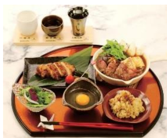
▲すき焼き和食御前2,900円 (日本酒飲み比べセット プラス1,000円)

海外からのビジターに向けた「和食プレート」は、すき焼き、天ぷら、串揚げなどの日本料理と、日本酒の飲み比べ(利き酒)が体験できます。利き酒は他にワイン・ウイスキー・ハイボールもございます。