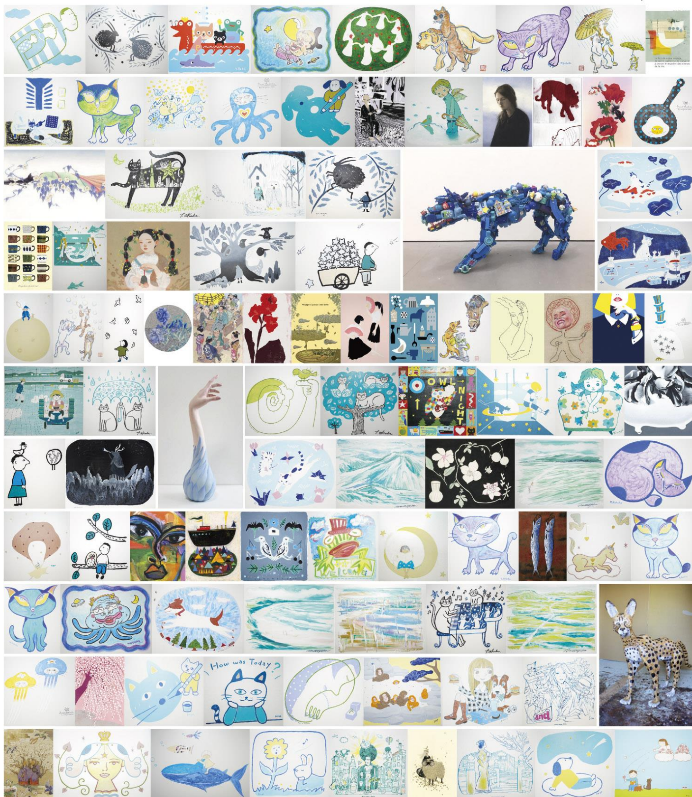
江戸時代に活躍し、いまもなお注目を集める伊藤若冲の日本画や世界的に注目を集める画家・石田徹也の複製画も展示しています。