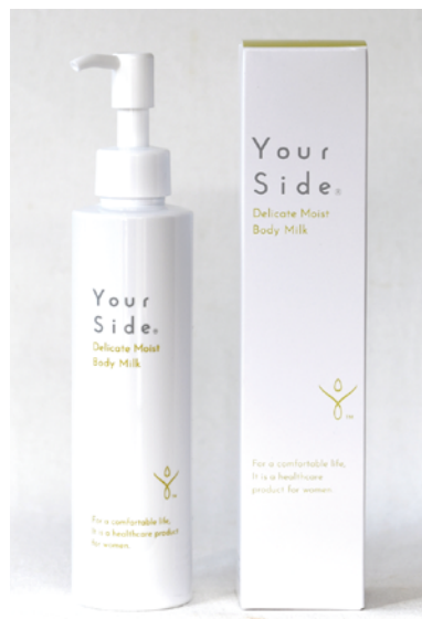
デリケート モイスト ボディミルク 200ml 3,200円 + 税