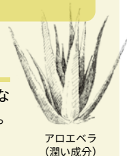
アロエベラ (潤い成分)