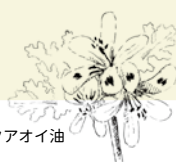
ニオイテンジクアオイ油