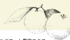
ベルガモット果実エキス