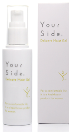
デリケート モイスト ジェル 50ml 2,700 円 + 税

デリケートモイストジェルは、デリケートゾーンにうるおいを与えるジェル。 日常コスメとしてもお使いいただけるので 「デリケートゾーンのケアをどうしてよいかわからない」 「デリケートゾーンに不快感*がある」 そんな人にもおすすめ。 うるおうことで、不快なカサカサを整えていきます。 *乾燥によるカサツキなど