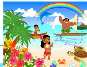
スクラッチ デザイン